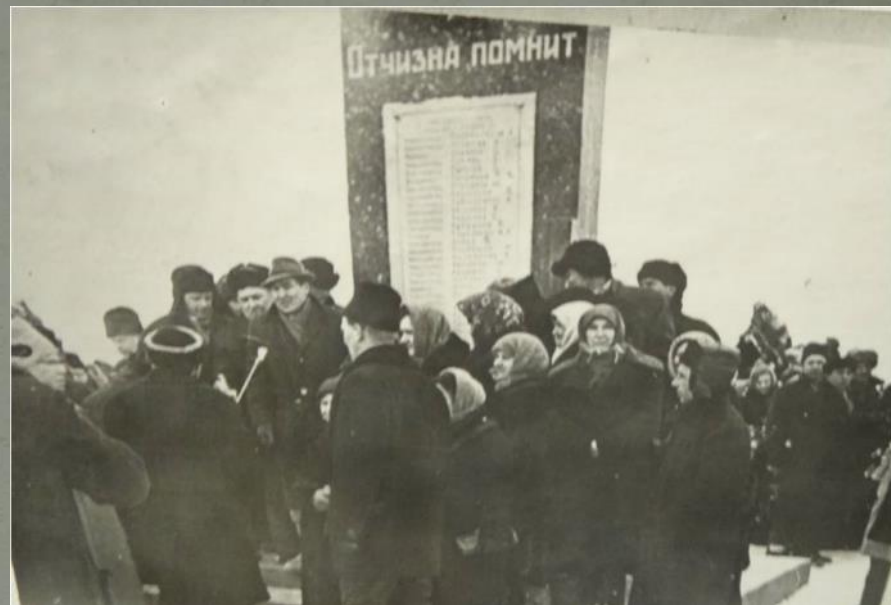
Второй приезд семьи на открытие памятника